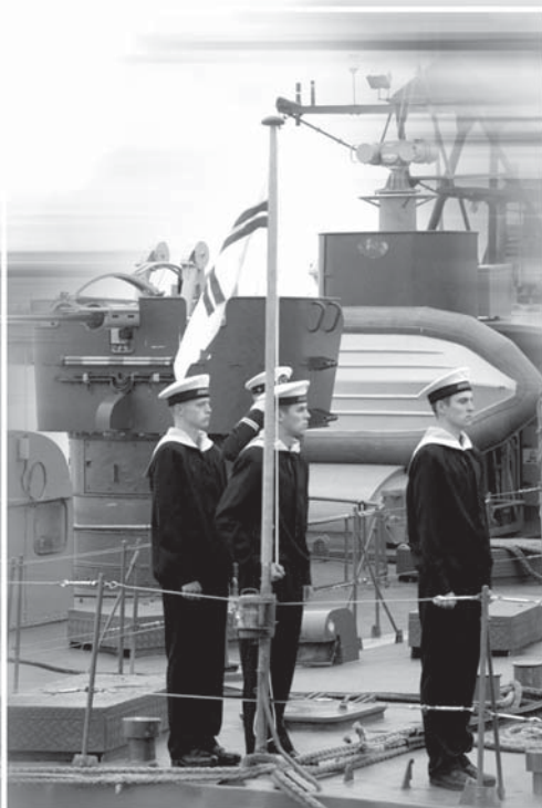
Raita Puriņa foto