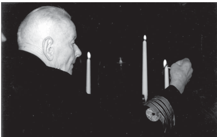
Pieminot tos, kuri savu lēmuma ostu sasnieguši uz zemes un jūrā