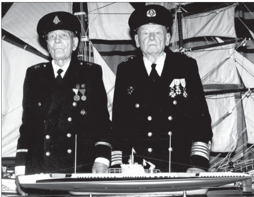
Mēs ar Griguli – pie Francijas vēstniecības dāvātā Roņa maketa