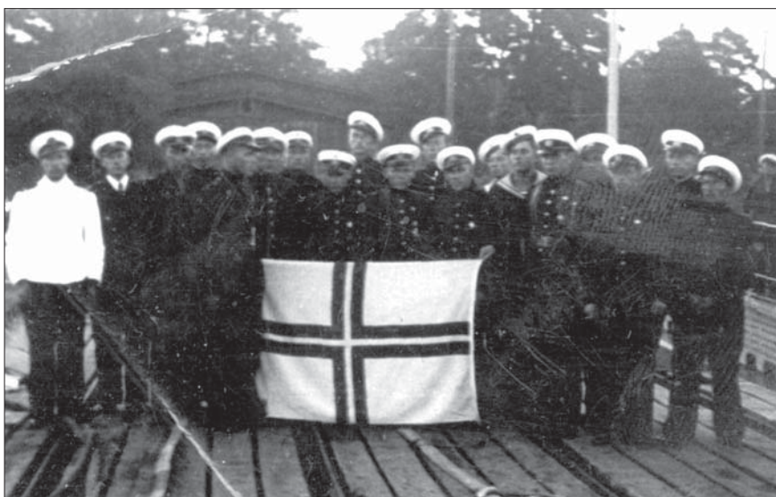
1940. gada 25. jūlijs. Liepājā Roņa komanda pēdējo reizi ar Latvijas kara flotes karogu