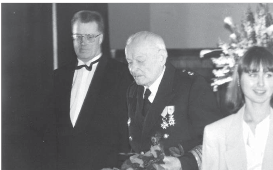
Otra Triju Zvaigžņu ordeņa saņemšana 1995. gadā