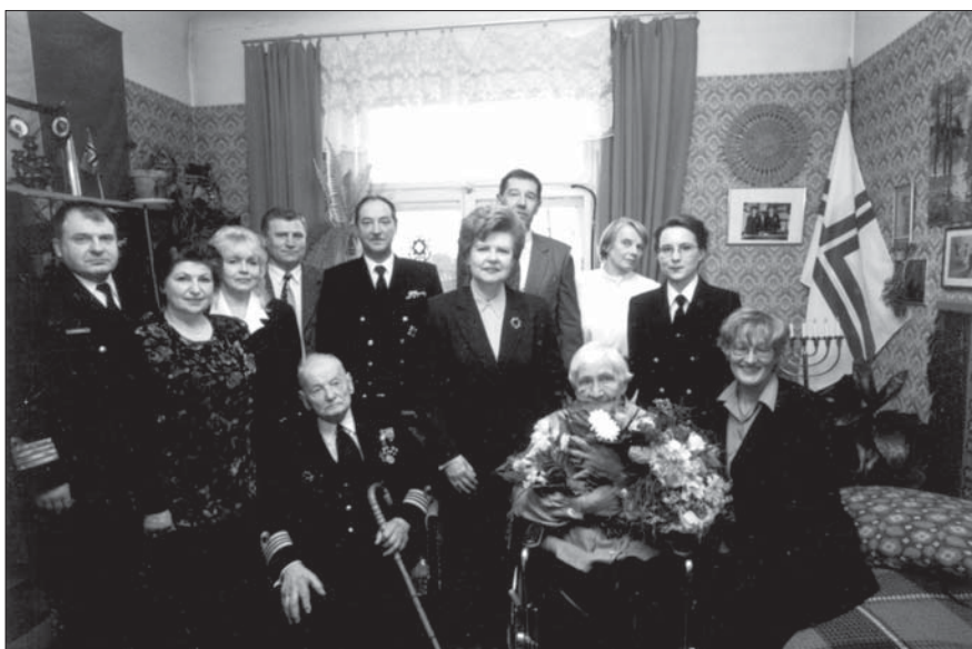
60. kāzu gadadienā kopā ar apsveicējiem un ģimeni