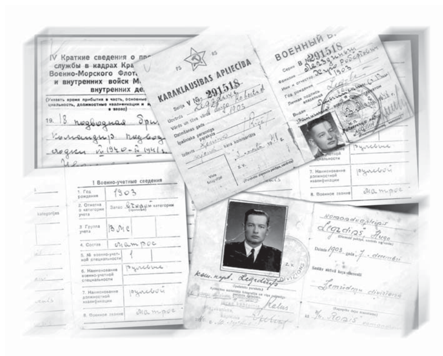
Kara un okupāciju varā