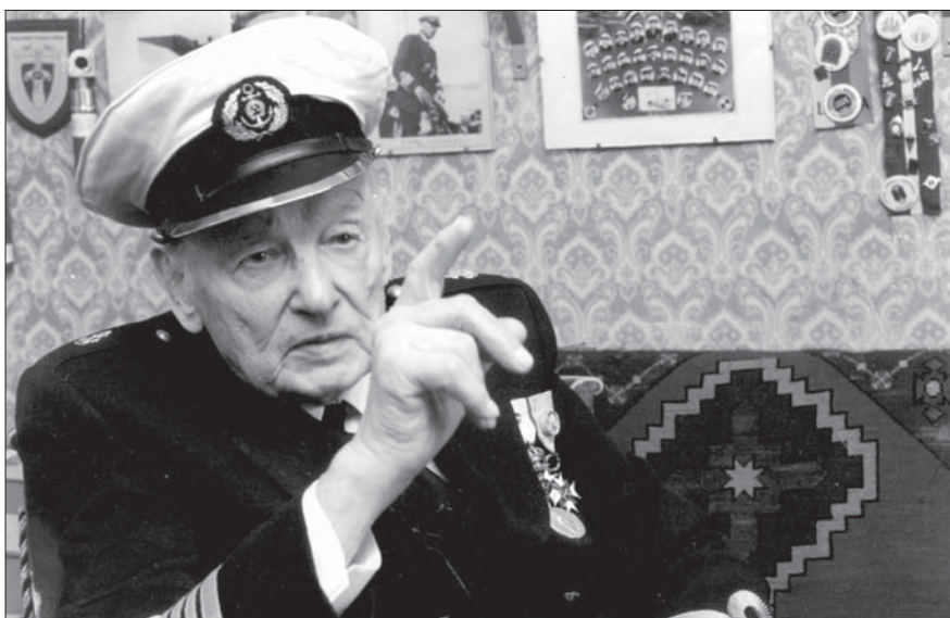
Esmu personīgi ticis ar visiem sešiem Latvijas Valsts prezidenti, un ar katru ir bijusi kāda darišana