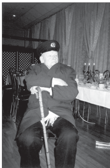
94 gadu svinības. Gaidu auto, lai brauktu mājās