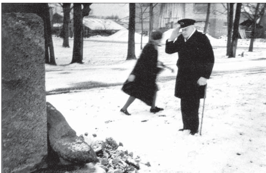
Piemīņas vietā Grobiņā, parādot godu pirmajam Latvijas admirālim A. Keizerlingam