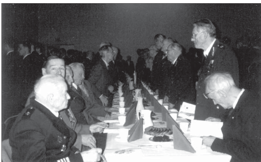
Melnās kafijas galds ar rupjmaizi un marmelādi