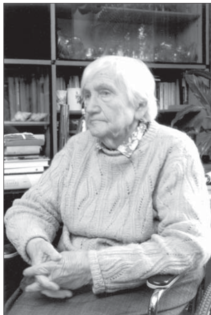
Mums ir kopīgi mūža gadi un bērni