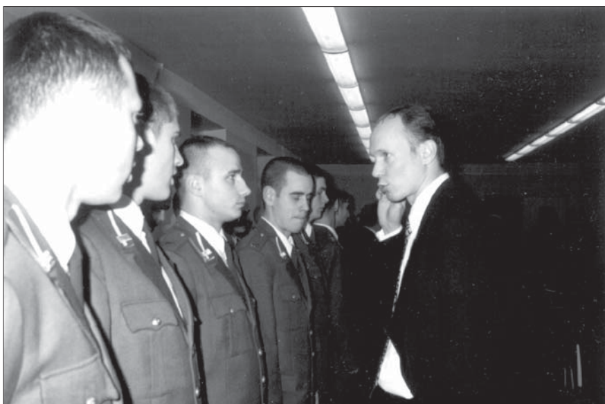
Melnās kafijas vakars – katru gadu 30. novembrī Nacionālajā Aizsardzības akadēmijā