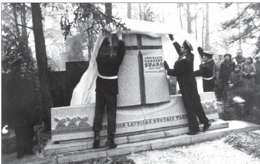
Pieminekļa atklāšana admirālim T. Spādem 1. Meža kapos Rīgā