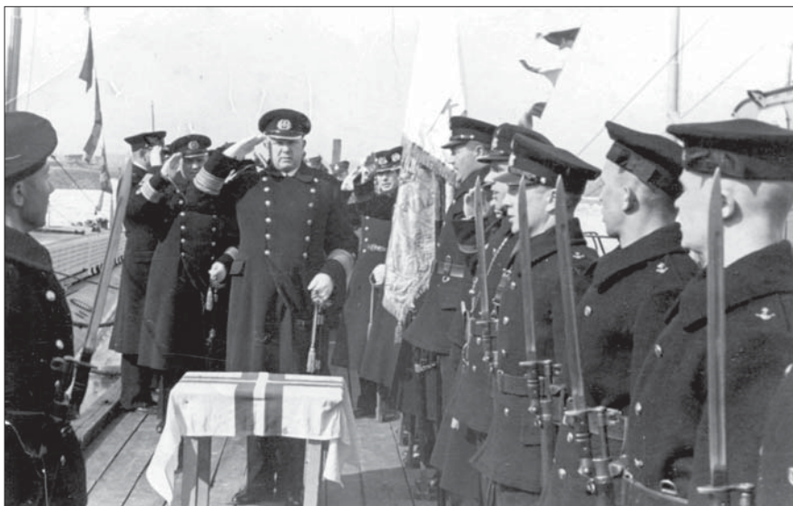
Admirālis T. Spāde un zemūdeņu komandas Andrejostā pēc pārbāzēšanās uz Rīgu